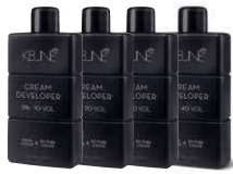
TINTA CREAM DEVELOPER Enthält LP 300, schützt und stabilisiert die Farbe. Contient du LP 300 pour une coloration plus durable dans le temps.